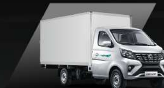
Thùng Kín composite