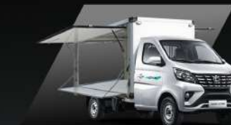
Thùng cánh chim