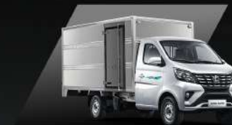
Thùng Kín inox