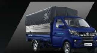
Thùng mui bạt

Đa dạng loại thùng cho nhiều mục đích vận chuyển khác nhau, nổi bật với kích thước thùng hàng siêu dài, giúp chuyên chở khối lượng hàng hóa lớn nhất trong phân khúc tải nhỏ máy xăng, tối ưu hiệu quả kinh doanh.